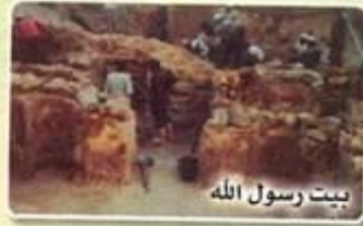
بيت رسول الله