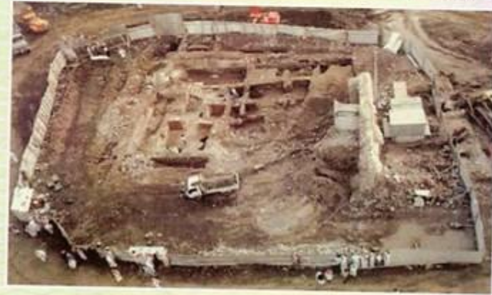
صورة شاملة لبيت رسول الله في منطقة الحفريات