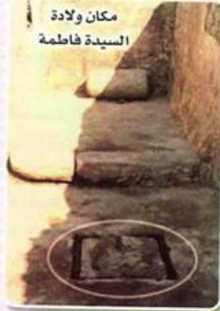
مكان ولادة السيدة فاطمة