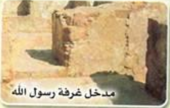
مدخل غرفة رسول الله