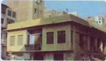
مكان ولادة رسول الله القيم مكانها مكتبة مكة

2 - من حليلة السعدية : عبد الله وأنيسة وحذافة (الشيما) أبناء الحارث .