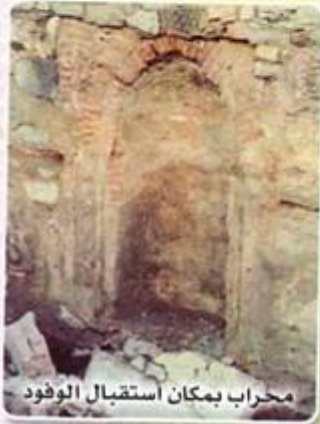
محراب بمكان استقبال الوفود