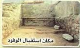
مكان استقبال الوفود